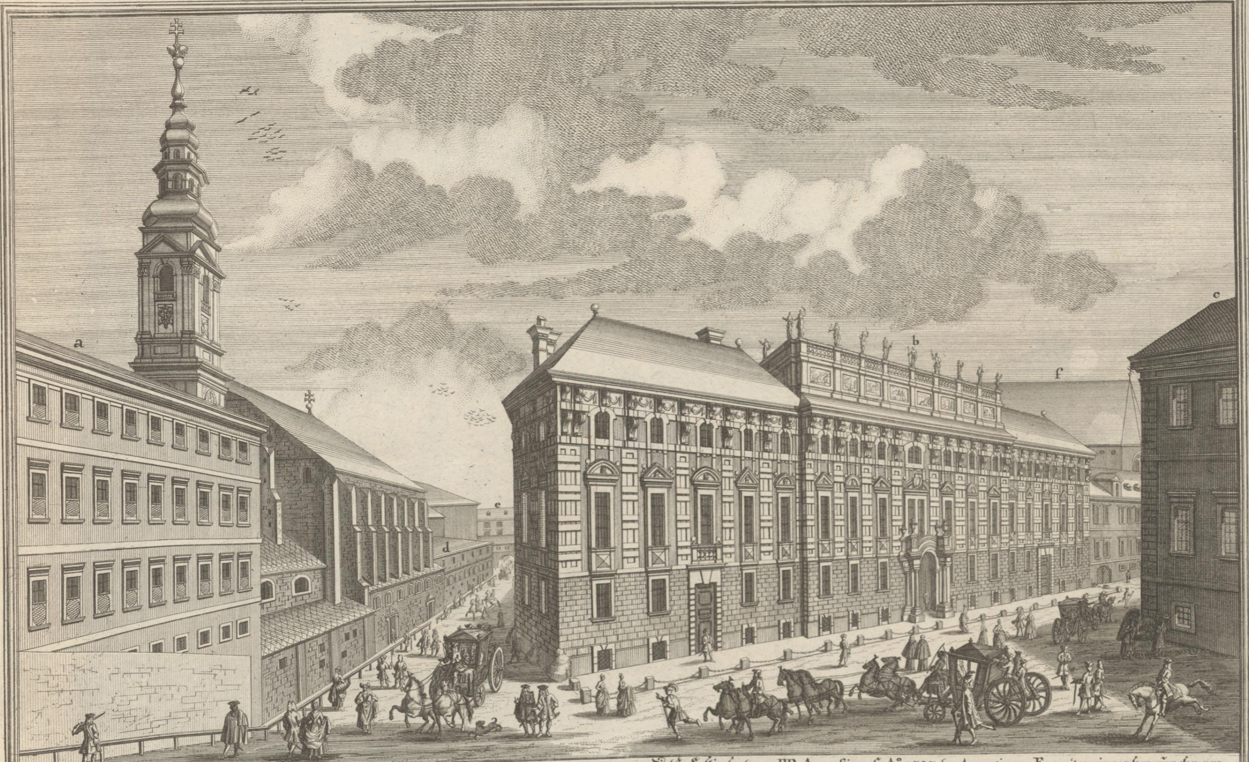
Templum aulicum S. AUGUSTINI A. 1327. Eremitis S. Augustini concessum, nunc incolitur. ab Augustinianis excalceatis. a. Monasterium S. P. Augustini. excalceat. b. Domus Comit. a. Dietrich stein. c. Hospitale civium. d. Domus equarum domitorum Cesar. e. Pars Aulae f. Templum S. Dorotheae.