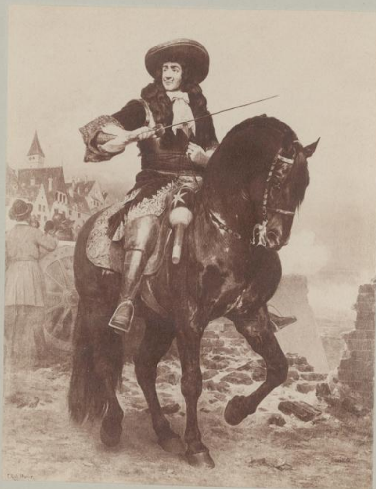
Ernst Rüdiger Graf Starhemberg.