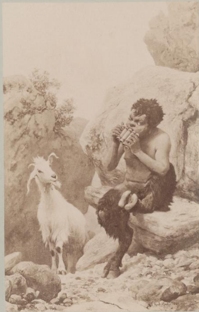
Faun und Ziege. Oelgemälde.