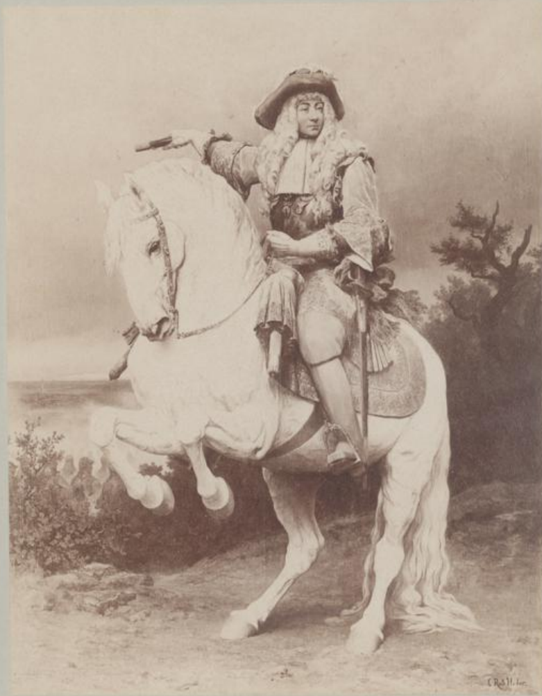
Carl Herzog von Lothringen.