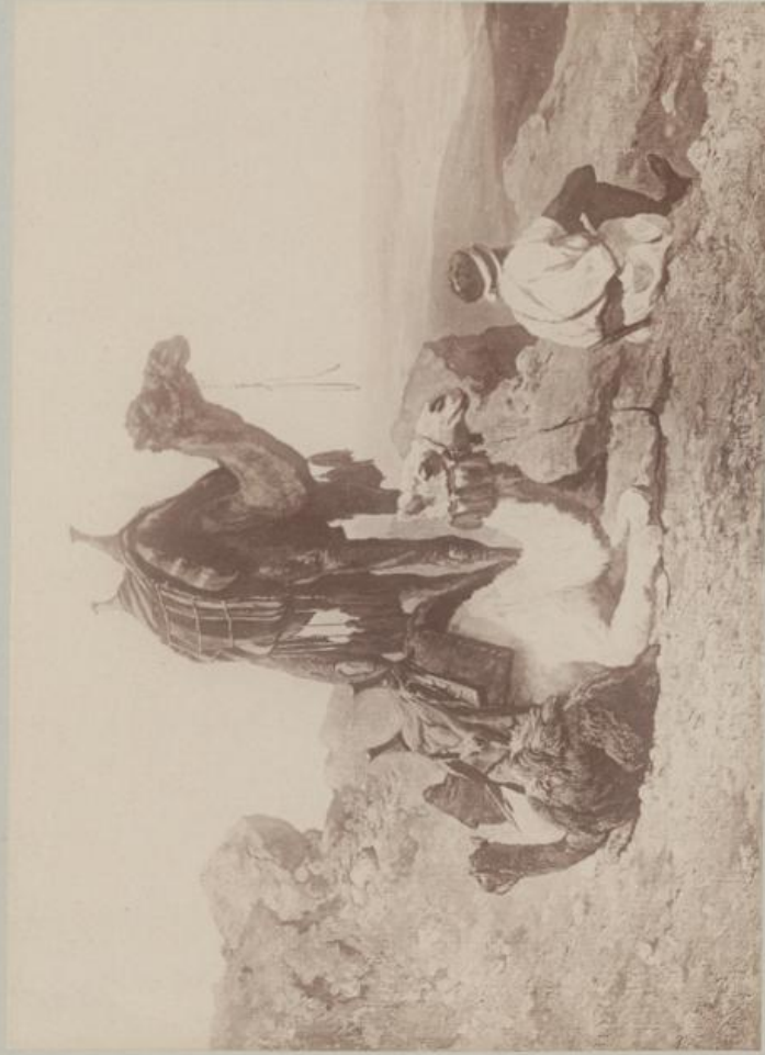
Rast in der Wüste.