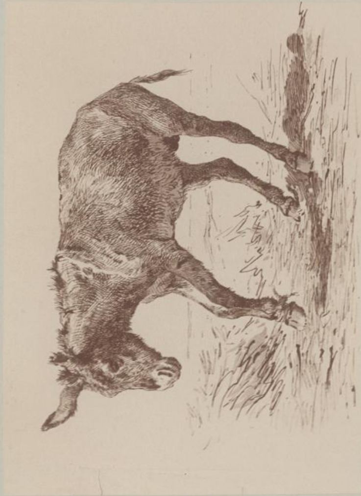
Der bestrafte Verbrecher. Federzeichnung.

(Aus dem Prachtwerke „Aegypten“ von Georg Ebers.) (Stuttgart, Deutsche Verlagsanstalt.)