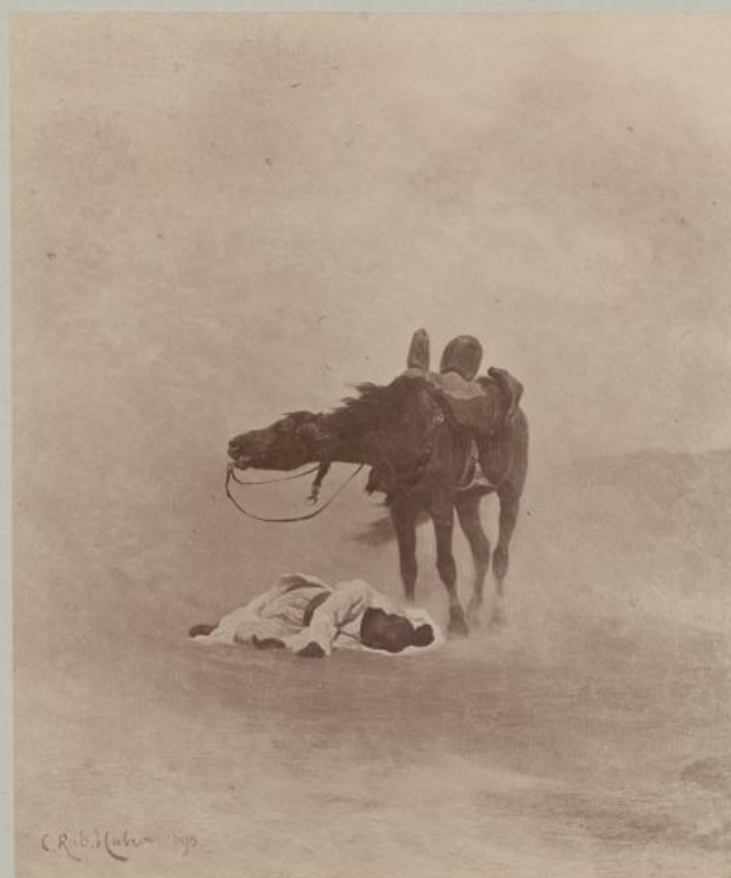
Der Tod des Beduinen.