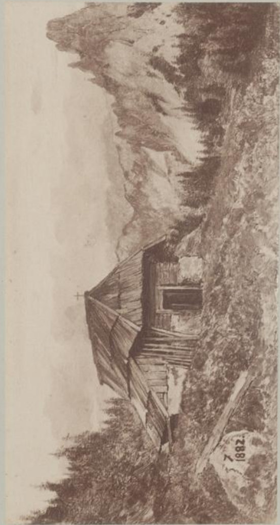
Kärntnerische Almhütte an der italienischen Grenze.