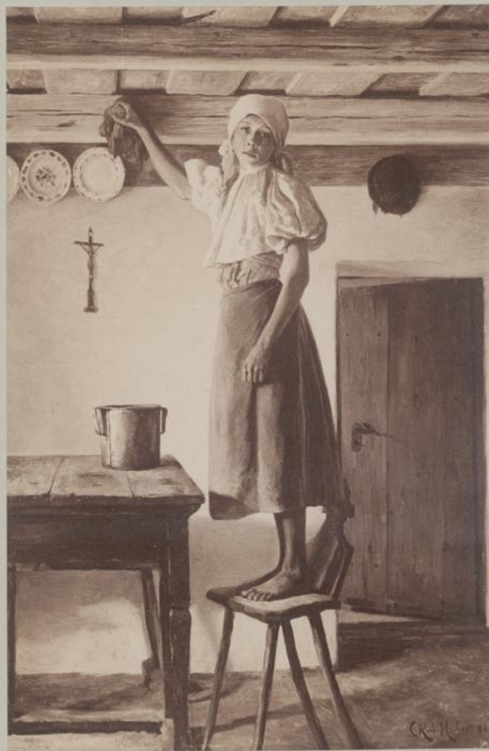
Scheuerndes Mädchen. Oelgemälde.