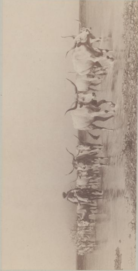
Ungarischer Ochsenzug. Oelgemälde.