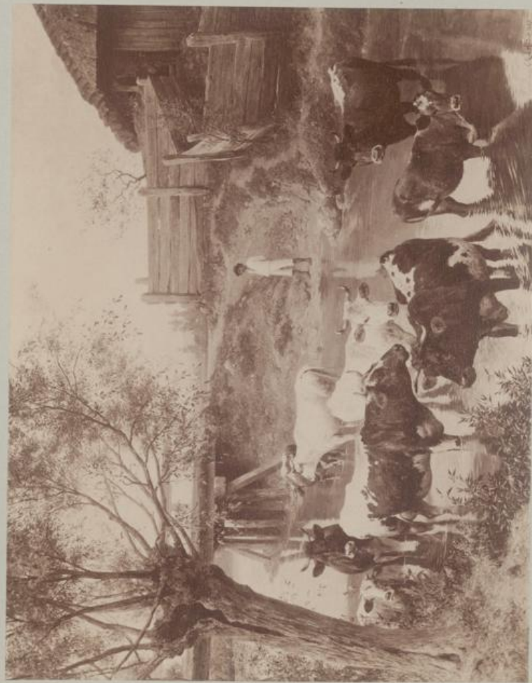
Kühe im Wasser.