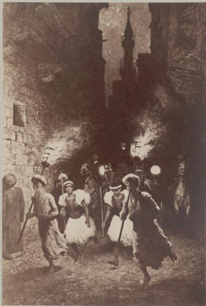
Ausfahrt einer Haremsdame. Oelgemälde.