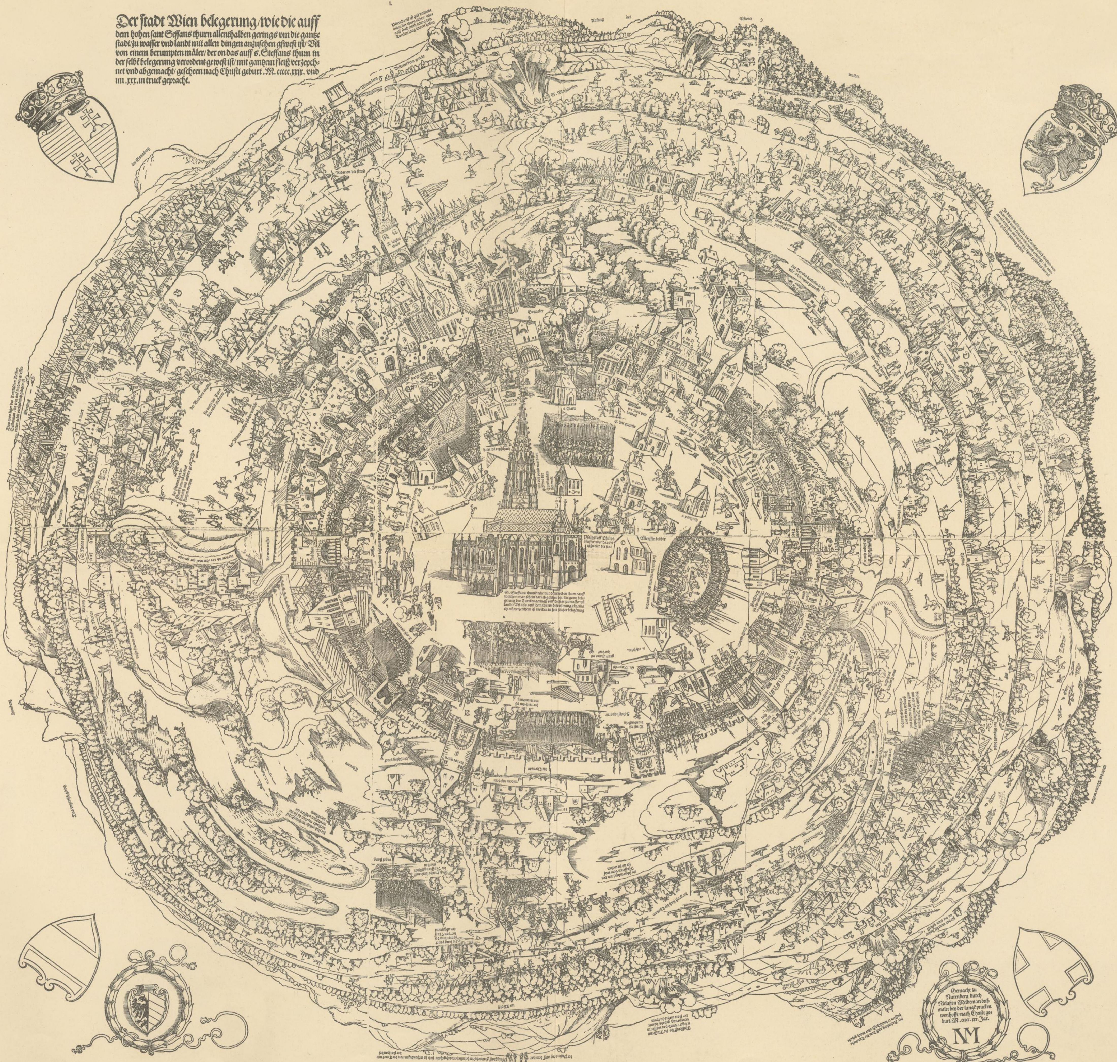
Rundansicht der Stadt Wien im Jahre 1529 von Niclas Melsdeman.

Der Stadt Wien belegung wie die auff den hohen sant Stefans thurn alle aufhaben gerings om die ganze stadt zu wasser und landt mit allen dingen anzusehen gheveht ist. Wi von einem berumpten mader der on das auff s. Stefans thurn in der selbe belegung verordenet gewest ist mit gancem fleiß verzeich- net und abgemacht geschehen nach Christi geburt. M. cccc. xxx. und im .xxx. in truct gemacht.