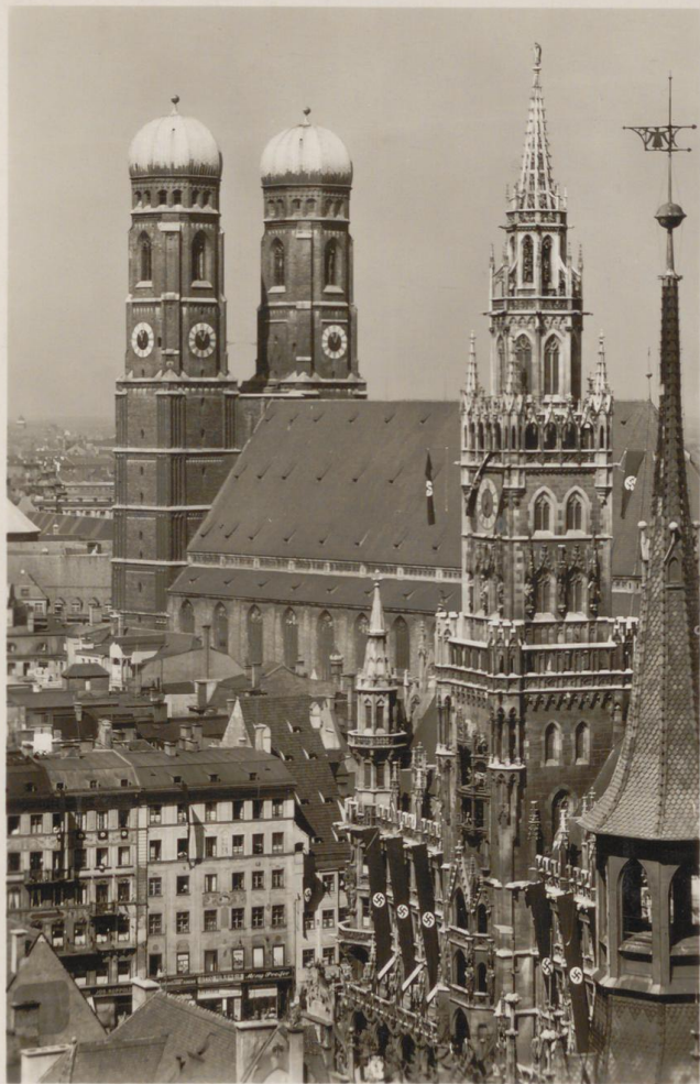
München. Rathaus u. Frauenkirche