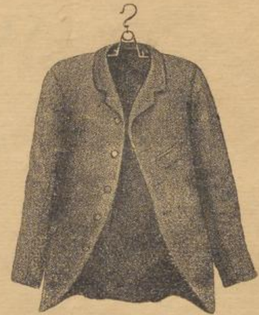
beim Gebrauch des Wiener Kleiderhalters.

Das Reinigen von Garderoben, sei es nun, dass dabei die bisherigen Kleiderbügel oder der an jedem Kleidungsstück angenähte Aufhänger benützt wird, ist ebenfalls mit sehr unangenehmen Missständen verbunden. Das Bürsten und Klopfen und das daraus resultirende Ziehen nach unten hat das Verziehen der Schulterform, bei längerem Gebrauch das Zerreißen des Futters unausbleiblich zur Folge. Bei Benützung des angenähten Aufhängers tritt sehr oft das Abreissen desselben und das dadurch entstehende Schadhafwerden des Kragens ein.