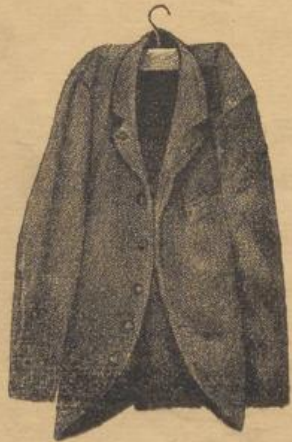
beim Gebrauch des alten Kleiderbügels.