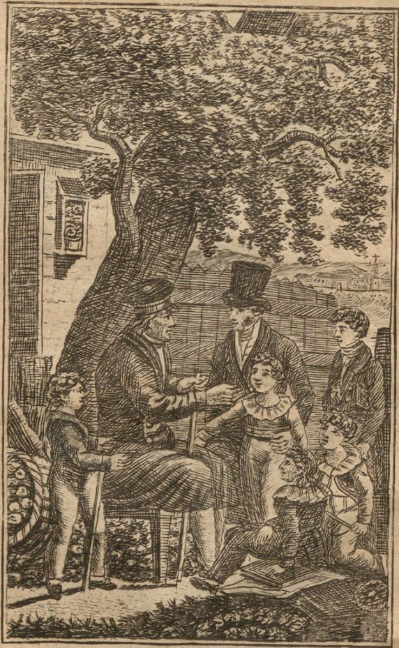
Gottlieb Ehrenreich bey'm Abendgespräche.