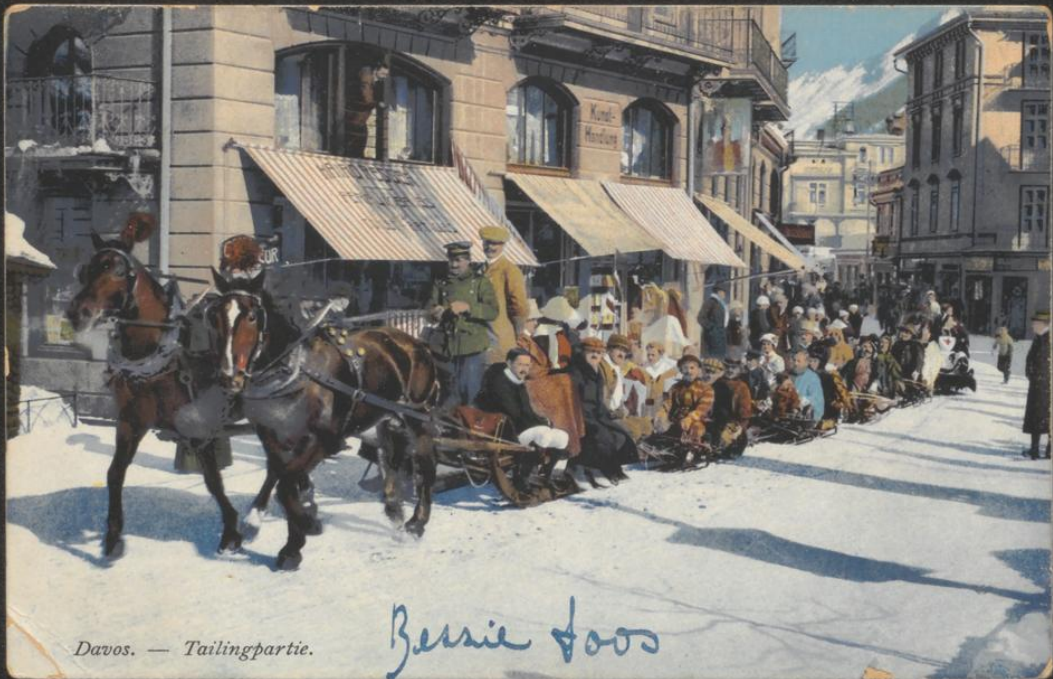
Davos. — Tailingpartie.