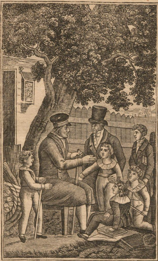
Gottlieb Ehrenreich beym Abendgespräche.