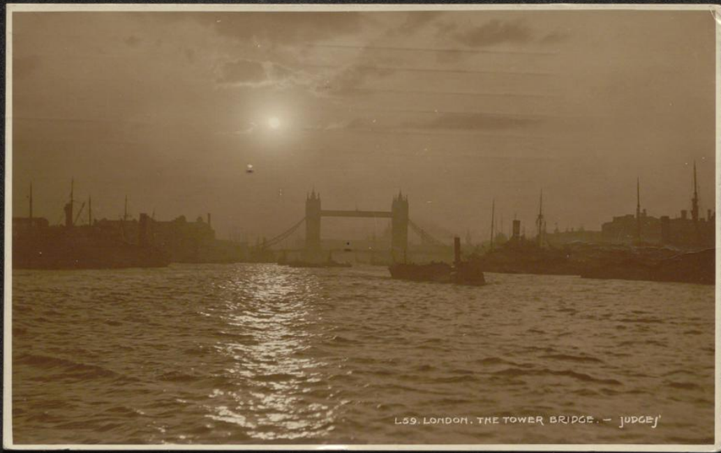
L59. LONDON. THE TOWER BRIDGE. - JUDGE'